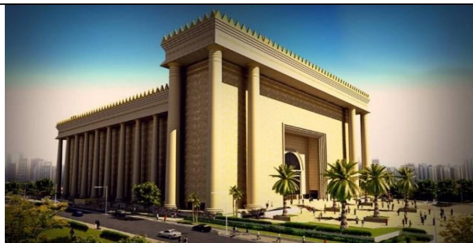
TEMPLO DE SALOMÃO