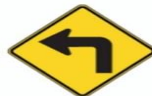
VIRE À ESQUERDA