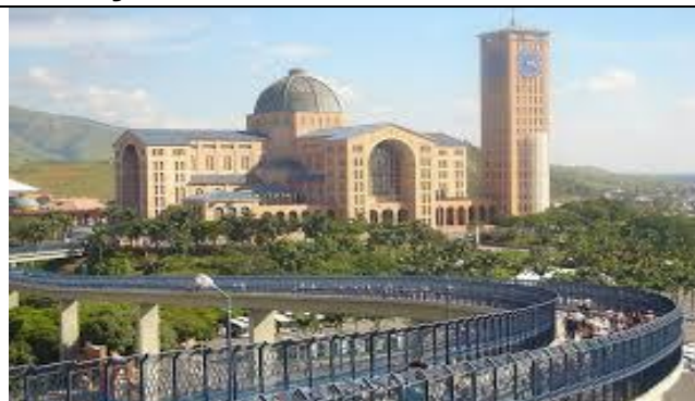
BASÍLICA DE APARECIDA

1-Desenhe uma peregrinação imaginária ou uma que você já tenha realizado: