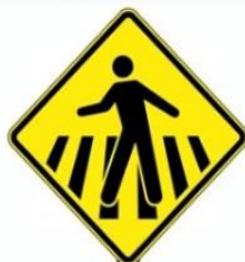
FAIXA DE PEDESTRE